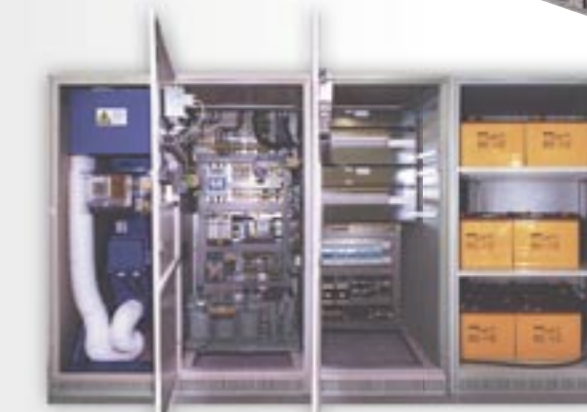
Power für alle Fälle: Diese Anlage garantiert wirkliche Sicherheit. Bei Netzausfall versorgen hochwertige Batterien die Verbraucher