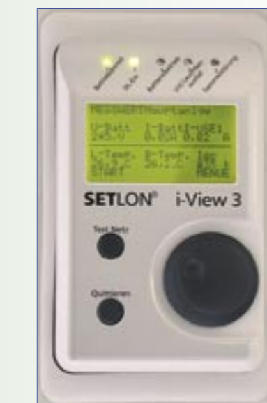
Totale Kontrolle mit dem grafischen Display des i-View