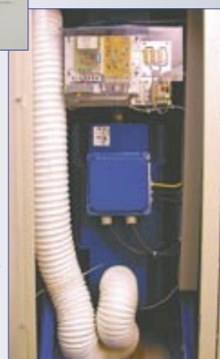
Gleichstrom-Nebenschlussmotor und Synchron-Generator sind übereinander montiert und durch eine Kupplung verbunden