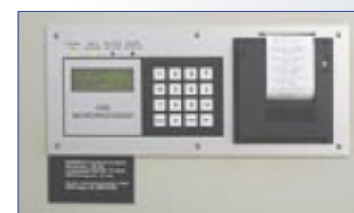
Das Melde- und Prüfsystem überwacht permanent das System und protokolliert sämtliche Daten